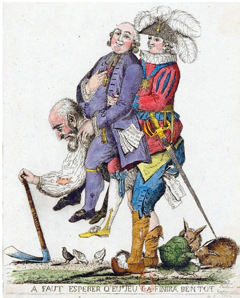
Caricature anonyme. 1789

Caricature de l'organisation de la société de l'Ancien Régime. Il est écrit au dessus « EXPLICATION DE L'ALLÉGORIE » et tout autour de l'image « le Tiers-Etat soutient seul le poids du royaume sous lequel il fléchit, un Noble, au lieu de le soulager, pèse dessus en s'appuyant, le Prêtre semble vouloir aider à soutenir ce fardeau mais du bout du doigt. » 1789.