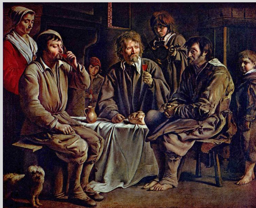
Le repas des paysans, par Louis Le Nain, 1642, musée du Louvre, Paris

★ Le troisième ordre, le Tiers État (plus de 25 millions de personnes) paie des impôts et ne participe pas au gouvernement. Les bourgeois, aisés et parfois très riches, voudraient jouer un rôle politique. Les artisans aimeraient plus de liberté dans leur travail. Les paysans (80 % des Français) vivent souvent dans des conditions misérables et croulent sous des impôts de toutes sortes.