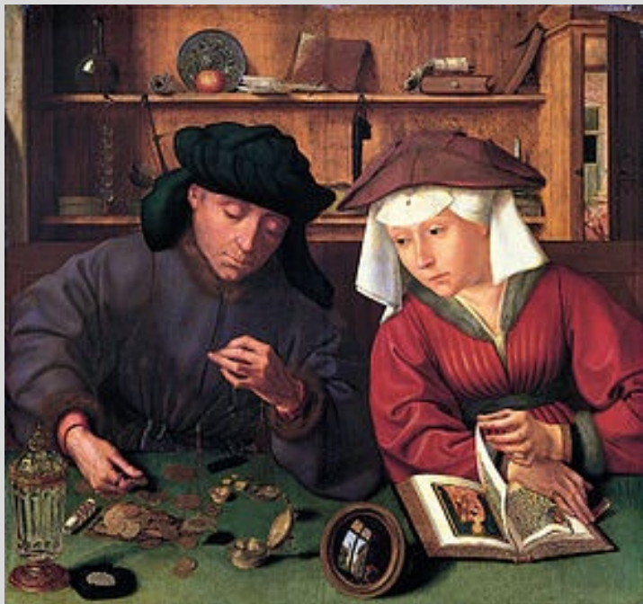
Des commerçants au XVIIème siècle. D'après Quentin Metsys.