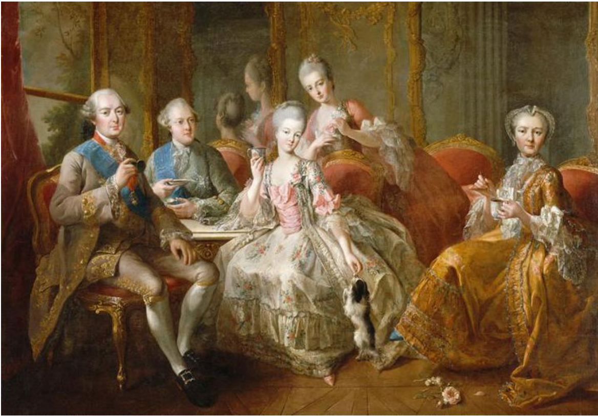
La Famille du duc de Penthièvre en 1768, dit aussi La Tasse de Chocolat – Jean-Baptiste Charpentier, le Vieux

★ C'est un des ordres privilégiés qui ne paie pas d'impôt. Autour du roi, les nobles vivent luxueusement et occupent les plus hautes fonctions. En Province, les nobles sont moins riches et vivent de leurs droits féodaux. Le rang de noble s'acquiert par la naissance et seulement si les parents sont aussi nobles.